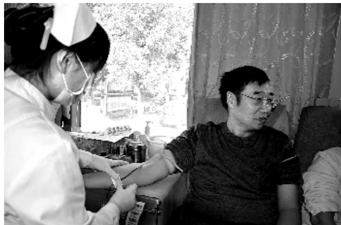
濮阳市妇幼保健院近日在院内开展了无偿献血活动,98名医务人员共献血近4万毫升。

报销封顶线提升至60万元,并试行特殊门诊病种单列单控管理,建立全市特殊门诊统一用药目录,探索制定医保和新农合统一用药目录。 (据12月13日《健康报》)